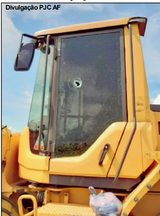
Local atingido por tiro disparado por suspeito preso

Caso ocorreu em propriedade na cidade de Nova Bandeirantes e suspeito preso em AF da tarde.