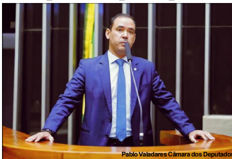
Pablo Valadares Câmara dos Deputados

Proposta de deputado será apresentada na Câmara