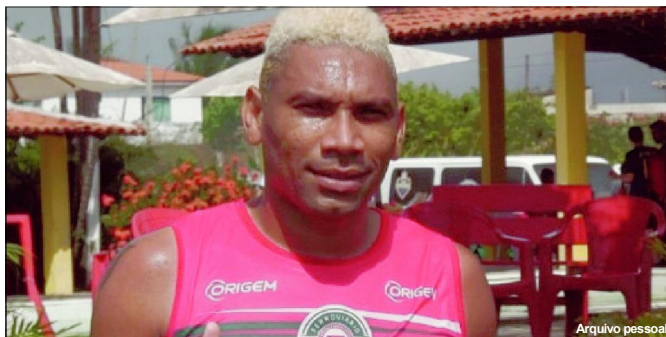
Caça-Rato está regularizado no BID