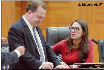
JL. Siqueira AL MT

Nova legislatura tomará posse no dia 1º de fevereiro e escolherá comando da AL para biênio 2023-2024