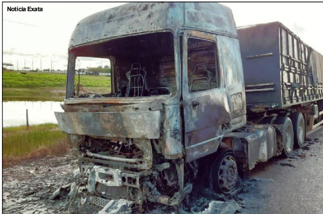
Cenário de destruição na MT-208 na tarde de terça-feira