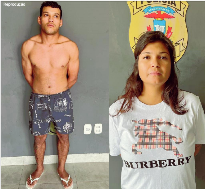
Pezão tinha mandado de prisão em aberto pelo desaparecimento de produtor

Polícia ainda deteve uma mulher e um jovem e apreendeu droga