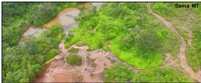
Operações que aconteceram em 2022 devem ser intensificadas ainda mais neste ano