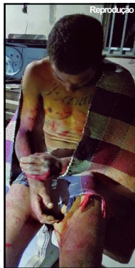
Jovem foi espancado e baleado por facção em AF

Um grupo armado sequestrou, espancou e atirou nas mãos de um jovem de 25 anos, morador de Alta Floresta. O caso foi registrado final de semana pela Polícia Militar e a vítima recebeu os primeiros socorros por parte do Corpo de Bombeiros.