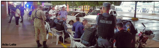
Operação realizada sábado à noite em Alta Floresta

Operação em Alta Floresta no sábado à noite mobilizou 41 agentes de segurança