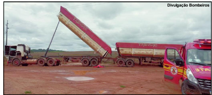
Contato da Carroceria com rede elétrica provocou descarga em trabalhador

Floresta, por meio de sua unidade na cidade, recebeu a solicitação para atendimento em uma ocorrência na Rodovia MT 010 - onde um condutor basculou uma carreta e a caçamba