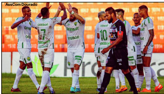
Cuiabá venceu em Rondonópolis