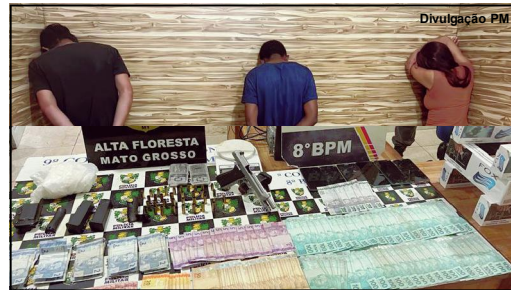
Trio foi preso pela PM sob várias acusações em AF

O caso investigado pela Polícia Civil já apontava suspeitos horas depois e no domingo à noite três pessoas foram capturadas.