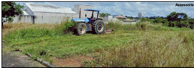
Proprietários de áreas serão notificados