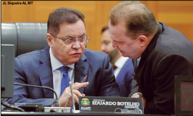
Os dois deputados não poderão compor a Mesa Diretora no próximo biênio