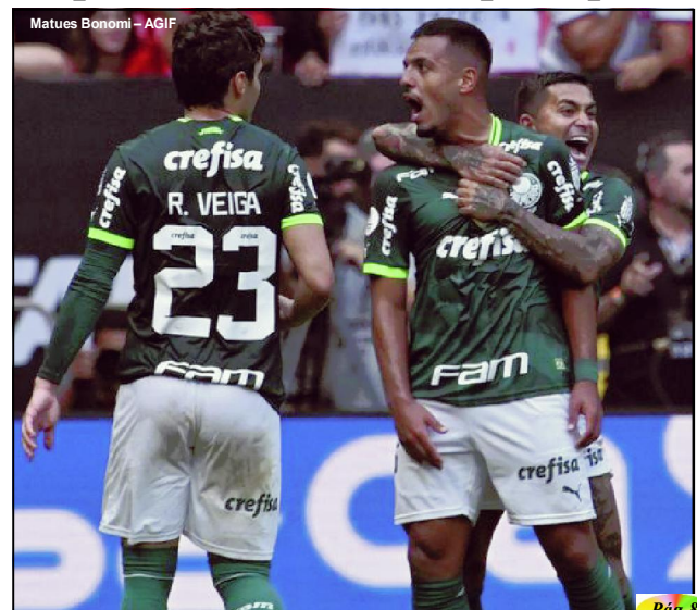
Mates Bonomi - AGIF