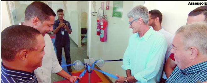
Prefeito e vereadores reinaugurando ampliação e reforma da Unidade de Saúde da Família no bairro Boa Nova