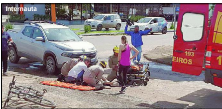
O acidente aconteceu na Av. A com A-3