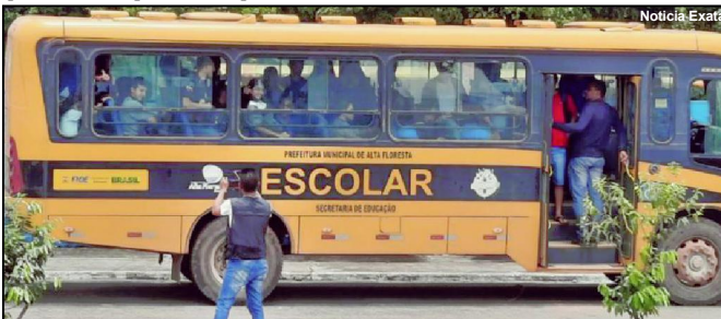
É proibido o transporte de alunos em pé

Conforme Só Notícias já informou, na última segunda-feira, dois morreram em troca de tiros com a polícia, em Barra do Bugres.