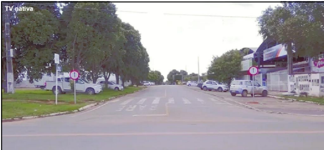
A alteração no trânsito tem como objetivo melhorar o fluxo de veículos

Conforme Eder, deverá ser oferecido um prazo de 30 dias para adequação da população a mudança do trânsito e posteriormente a isso, será iniciada a fiscalização.