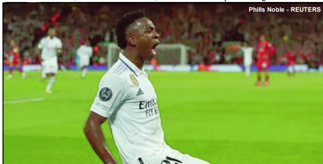
Vinicius Júnior teve grande atuação com dois gols

O jogo de volta está marcado para o dia 15 de março, quarta-feira, no Santiago Bernabéu. O Real Madrid avança mesmo que perca por dois gols de diferença. Para avançar sem a necessidade de prorrogação e pênaltis, o Liverpool tem que golear por uma margem de quatro ou mais gols. Não há critério do gol marcado fora de casa na Champions League.