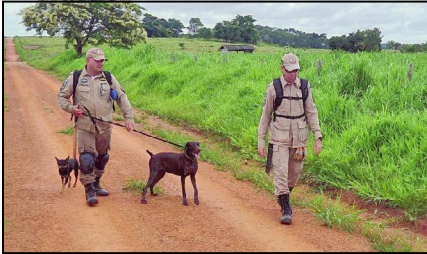
O fato aconteceu no assentamento São Pedro