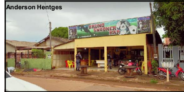
Segundo informações preliminares, o homem teria atirado contra os amigos com uma espingarda