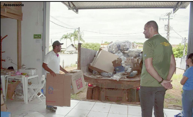
Projeto piloto da ASCALFLO

Estão envolvidas a Prefeitura de Alta Floresta, através das secretarias de Meio Ambiente e Sustentabilidade e Infraestrutura e Serviços Urbanos, além do Ministério Público, Ministério Público do Trabalho e Defensoria Pública. Também ASCALFLO e comércio de Alta Floresta.