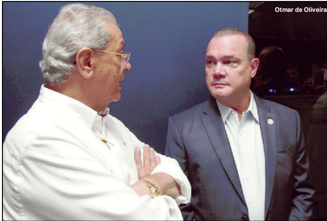
Dados estão disponíveis no portal Transparência do Senado