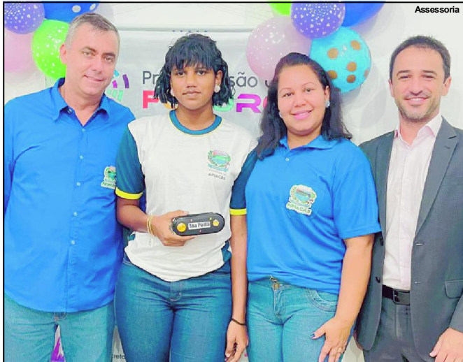
Prefeitura de Apiacás implanta Projeto Visão do Futuro