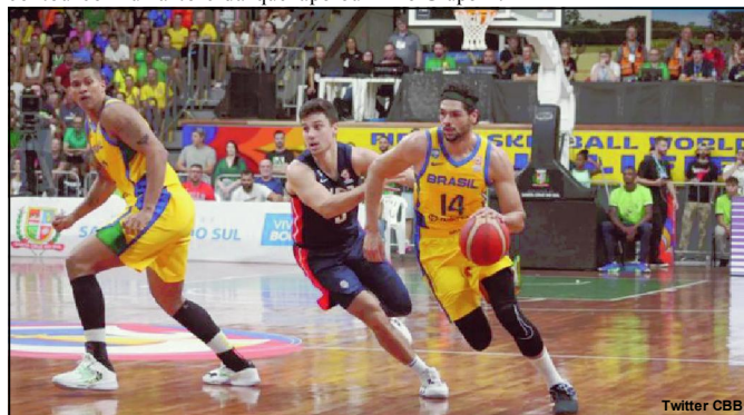
Brasil vence os EUA e se classifica para o Mundial

A seleção terminou em quarto no Grupo F, com oito vitórias em doze jogos, mesma campanha de México e Porto Rico. Porém, levou a pior nos critérios de desempate (confronto entre os times empatados). Contudo, a eliminatória americana dava sete vagas no Mundial. Os três melhores de cada grupo e o melhor quarto colocado. E nessa a seleção levou a melhor sobre a Argentina, que foi quarta no Grupo E.