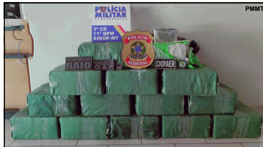
As operações aconteceram no aeroporto de Sinop

Sinop, foram encontrados 14 fardos. Em Poconé, a droga estava escondida em uma área de mata densa, ocultada com mantas de lona, dividida em 50 fardos. Na mesma região do Pantanal onde a droga foi