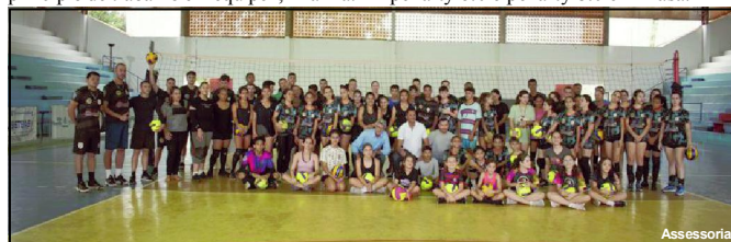
Registro da visita do Prefeito Chico Gamba aos alunos das escolinhas

Como forma de incentivar os atletas são realizadas melhorias constantes, como por exemplo, recentemente foram adquiridas 80 bolas de voleibol da marca penalty 6.0 e penalty 8.0 e mikasa.