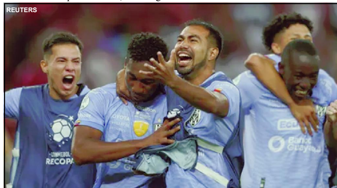
Del Valle conquista Recopa no Maracanã

amarga mais um revés em 2023. O clube também perdeu a final da Supercopa do Brasil para o Palmeiras e foi eliminado na semifinal do Mundial de Clubes, com o terceiro revés reflete desconfiança no trabalho do técnico Vitor Pereira.