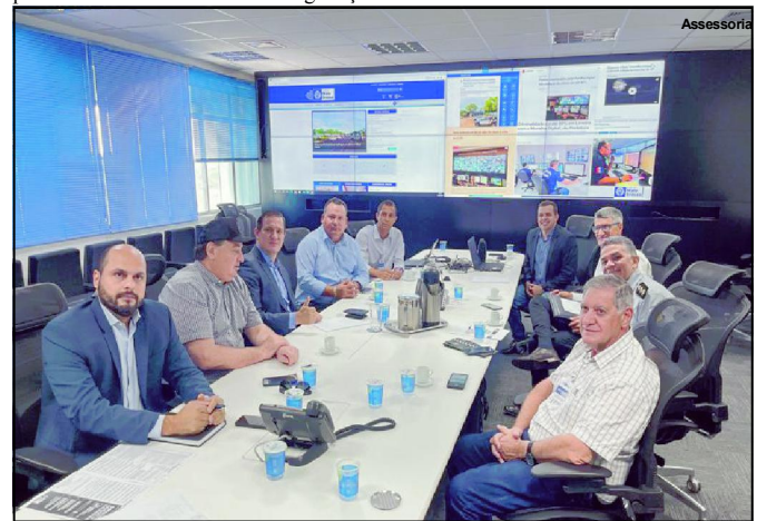
Programa Vigia Mais MT

A data do dia 08 de março é um dia para reflexão a respeito de toda a desigualdade e violência que as mulheres sofrem. É um momento para combater o silêncio que existe e que normaliza esses crimes, além de ser um momento para repensar atitudes e tentar construir uma sociedade sem desigualdade. Vamos continuar na luta por dois melhores para as mulheres do nosso Mato Grosso, e, quem sabe, nossa iniciativa possa vir a inspirar outros Estados. Vou continuar as campanhas de conscientização sobre os direitos das mulheres dentro dos órgãos públicos, e também defender de maneira intensa a igualdade entre homens e mulheres. Nós, mulheres, merecemos a Superação, a Esperança e o Respeito. Nós merecemos SER Mulher com dignidade. Virginia Mendes é primeira-dama de MT, economista, voluntária na Unidade de Ações Sociais e Atenção à Família, idealizadora dos programas e projetos sociais do governo do Estado, a exemplo do programa SER Família.