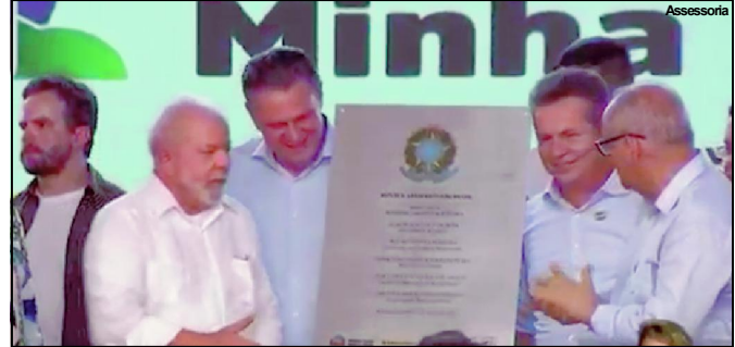
Lula inaugura residencial em Rondonópolis

manifestantes protestando, com faixas, contra o presidente.