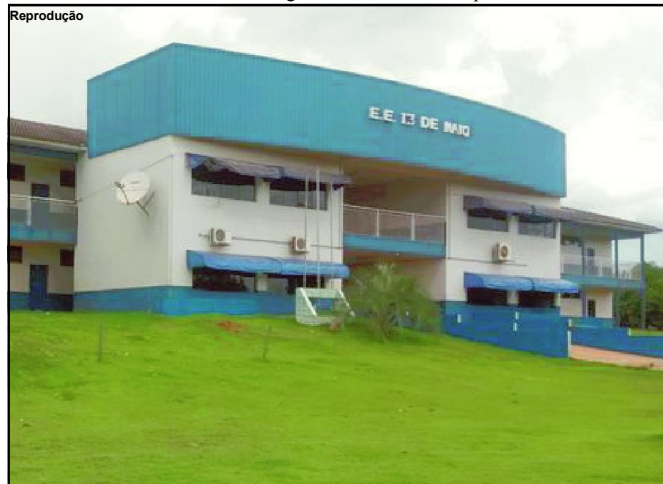
Polícia Civil prende ex-diretor investigado por desvio de mais de R$ 250 mil de escola

O juízo da Comarca de Terra Nova do Norte acatou a representação da Polícia Civil, com a decretação da prisão preventiva, bloqueio de contas bancárias e apreensão de bens.