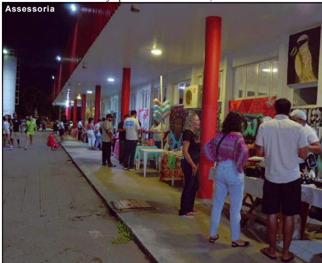
Varanda Criativa oportunidade para expor talentos

Em todas as edições tem o palco aberto e “aulão”. Também há espaço para comercialização dos produtos dos artesãos, aonde, além de vendas, também fortalecem seu networking. Em média cada edição atrai 50 expositores. “O evento fomenta a criatividade dos artesãos”, finaliza.