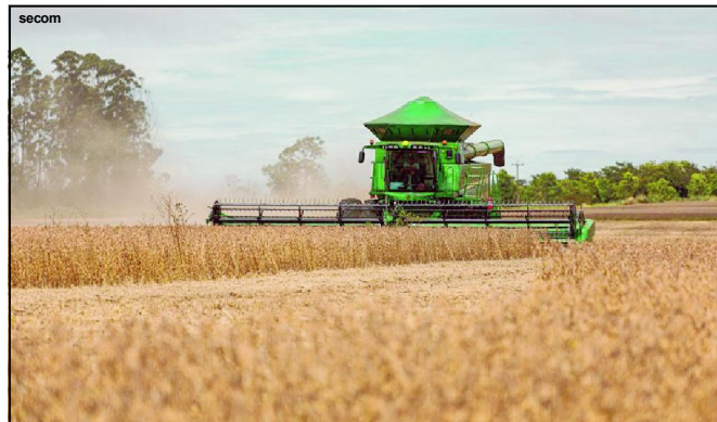
MT entre os maiores produtores de soja do mundo