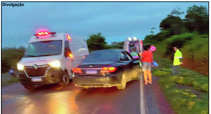
Acidente aconteceu na “Baixada da estrada A”