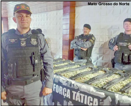
Foram entregues fuzis T-4, além de espingardas Benelli, consideradas as melhores do mundo