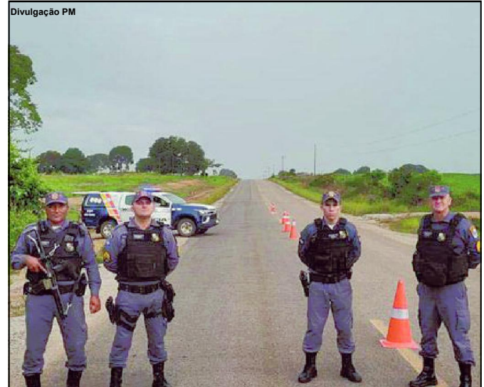
Os bloqueios foram realizados nas MTs 208 e 320

Após pegarem o dinheiro e pertences das vítimas, foragiram do local. O caso foi encaminhado à Polícia Civil.