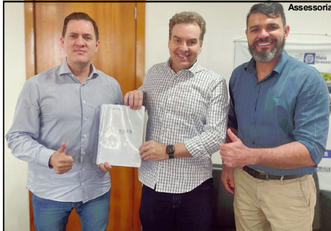
Metamat doa 45 torres de transmissão para a Sesp

As torres são usadas como para antenas de recepção e transmissão de sinais rádio, telefone, televisão e demais serviços de conectividade