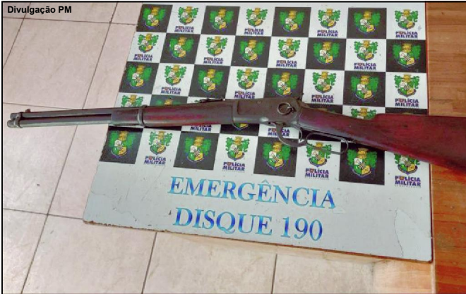
Arma de fogo de calibre restrito e sem registro