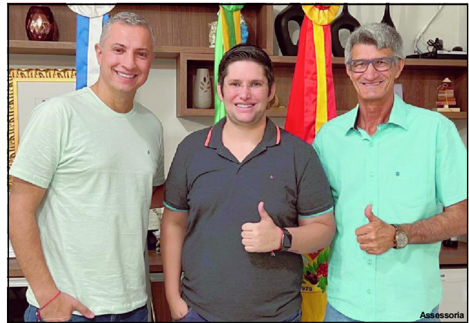
A emenda irá beneficiar o setor da saúde