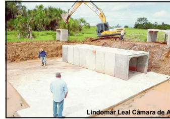
Presidente da Câmara em visita à obra na zona rural de Alta Floresta.

A galeria de concreto armado conta com uma base de concreto armado de mais de 90 metros quadrados e três canais de vazão para passagem do córrego. A estrutura de concreto armado também conta com 16 aduelas. De acordo com a Secretaria de Infraestrutura e Serviços Urbanos a obra tem durabilidade mínima de 50 anos e está sendo construída com recursos próprios.