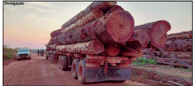
Operação com abordagens em estradas resultaram em apreensões

15 anos, com 1.620 km² no Mato Grosso e 1.312 km² em Rondônia.