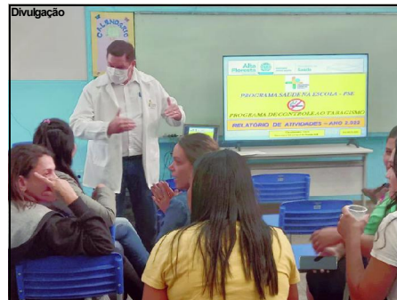
Palestra do PSE em escola de Alta Floresta