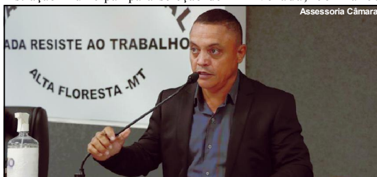
Projeto de Habitação é proposta sempre defendida pelo legislador do MDB.

“Você que está à espera da tão sonhada casa pode ter certeza de que agora vai sair”, afirmou.