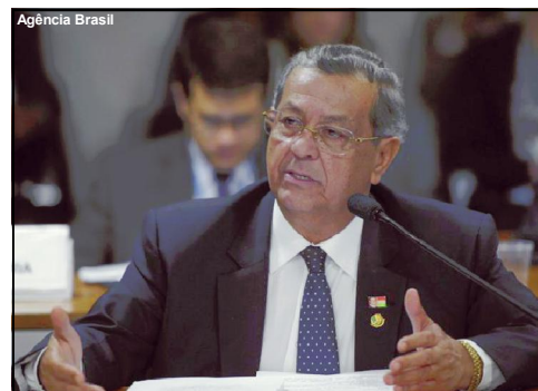
Parlamentar mato-grossense articulando para Comissão de Ética no Senado.