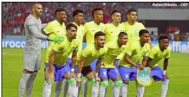
Onze inicial do Brasil