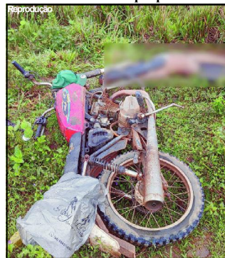
Vítima totalmente despida foi encontrada morta ao lado de motocicleta

Assassino deixou escrita em papel dizendo que procurava vítima há muito tempo