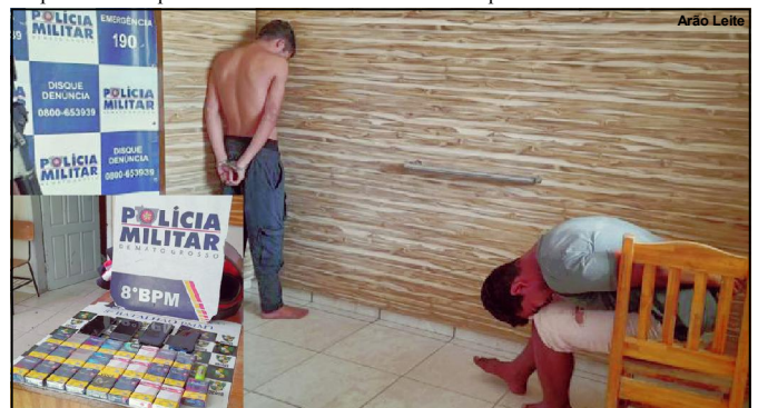
Jovens foram presos pela PM em Alta Floresta e produtos recuperados