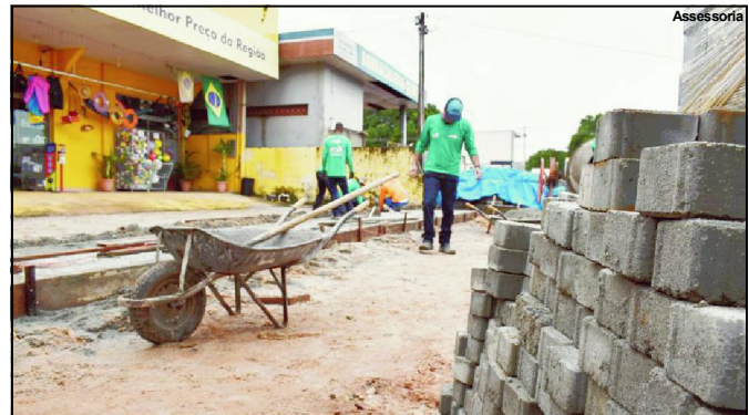
Região central em obra no município de Alta Floresta

O prefeito explica que, através do Programa Nova Chance cria-se uma rede de ações do bem e a sociedade ganha. “Todas as pessoas merecem uma nova oportunidade. Essa parceria entre Prefeitura e Poder Judiciário, somados os esforços do comércio local, é capaz de transformar Alta Floresta. Sempre digo que ninguém faz nada sozinho. Vamos juntos construir uma Alta Floresta cada vez mais forte e bonita”, finaliza.