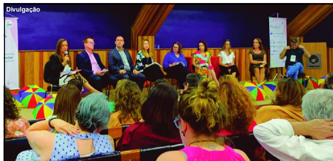
Simpósio realizado entre os dias 20 e 23 de março