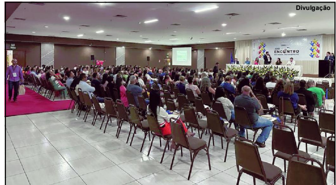
Alta Floresta é representada em evento em Cuiabá

Ao total foram 187 experiências inscritas, 63 experiências pré-selecionados pelo critério populacional, 28 experiências pré-selecionados considerando número total de experiências inscritas por município, 10 experiências modalidade CoSEMS, e 5 experiências externas considerando os objetivos da mostra, que mesmo sem concorrer a premiações, evidenciam ações que contribuem na consolidação do SUS.