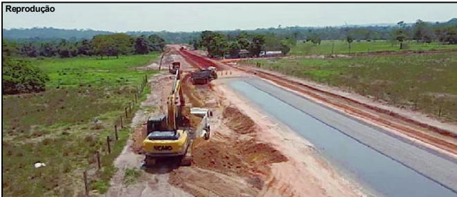
Obra melhora trafegabilidade e dá alternativa de escoamento de produção