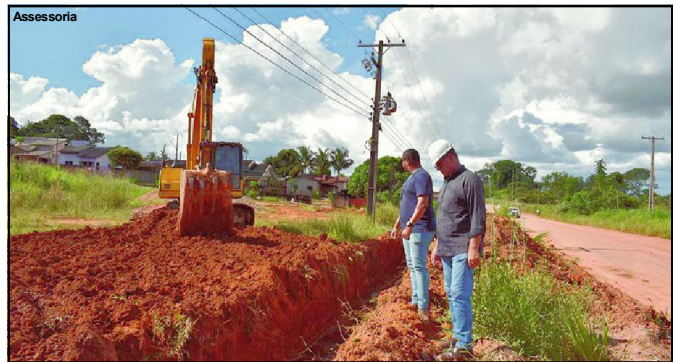
Secretário de infraestrutura acompanhando obra de drenagem