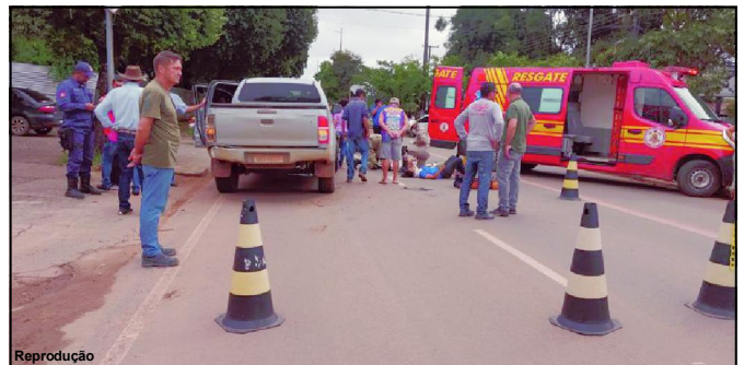
Momento do resgate das duas vítimas na Avenida Ludovico em AF

Caso em AF teve condutora com suspeita de fratura no braço e carona com corte no joelho