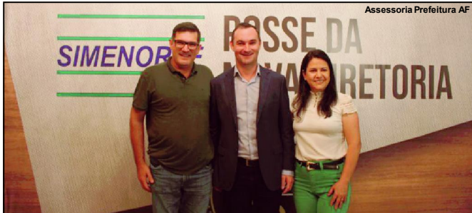
Solenidade de posse da nova diretoria do Simenorte em AF