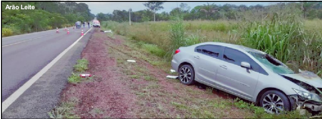
Carro invadiu pista contrária e bateu violentamente em moto com vítimas

Homem de 32 anos foi ouvido e liberado mediante fiança de dois salários