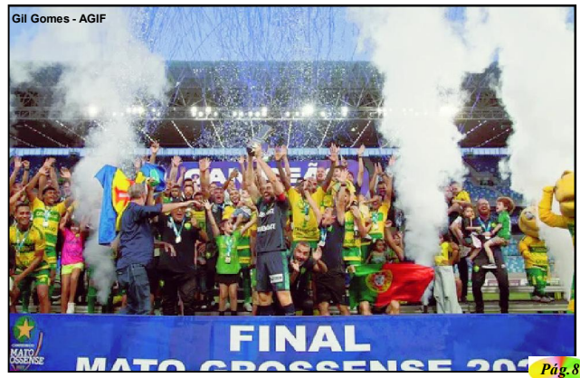
Gil Gomes - AGIF