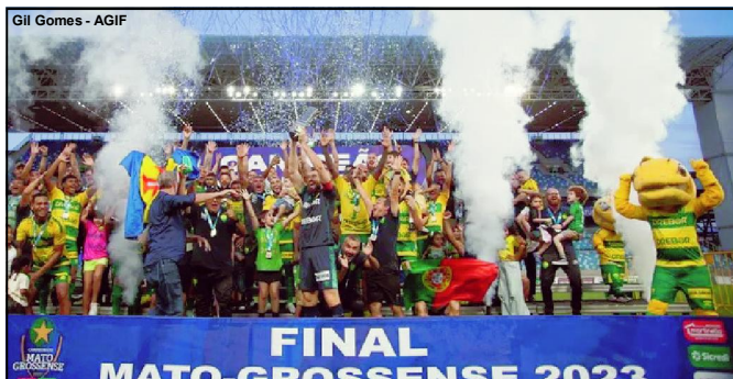
Cuiabá, dodecampeão estadual