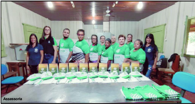
Curso realizado em parceria com o Senar em AF