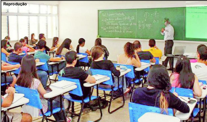
Governo promete novas medidas para garantir a segurança nas escolas estaduais, em Mato Grosso