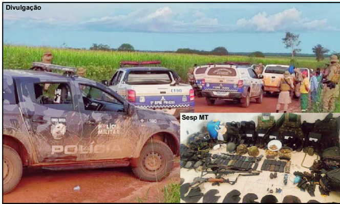
Forças de segurança apreenderam também arsenal com os bandidos

Desde o primeiro dia de perseguição, dois mortos e um preso até esta quarta-feira