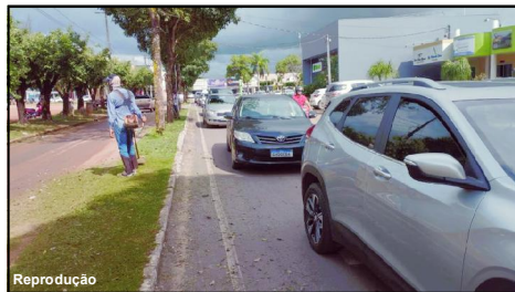
Fato ocorreu na manhã de ontem em Alta Floresta

Técnica de enfermagem ficou revoltada e disse que quer o ressarcimento