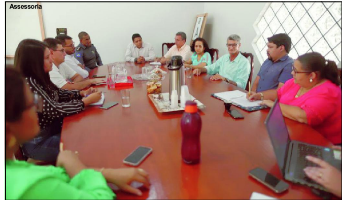
Administração de Alta Floresta debatendo segurança nas escolas

A Polícia Militar já desenvolve um trabalho junto às unidades escolares do município, com Programa Educacional de Resistência às Drogas e à Violência – Proerd. “Temos equipes nossas já trabalhando e presentes nas escolas durante os dias letivos e oferece a melhoria constante nessa sensação de segurança na comunidade escolar, além disso nossa equipe de rua em intensificando o policiamento, se fazendo presente nessas comunidades escolares, intensificando o policiamento ostensivo preventivo. Estamos aqui agora participando junto com os demais atores desse conjunto relacionado à educação, buscando uma forma de melhorar, uma forma de aumentar essa sensação de segurança e