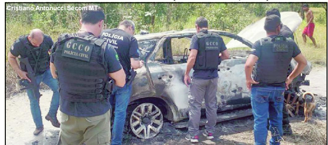
Equipes da Polícia Civil estão em campo realizando levantamentos, inclusive, no Estado do Tocantins, onde dois assaltantes do bando foram mortos

Após o assalto frustrado, os criminosos roubaram veículos de moradores e incendiaram em pistas, nas saídas da cidade, para dificultar a ação das polícias.