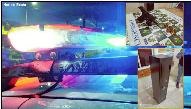
Pistola 9 MM apreendida juntamente com cofre

A polícia ainda realizou diligências para localizar os bandidos, mas eles não foram encontrados.