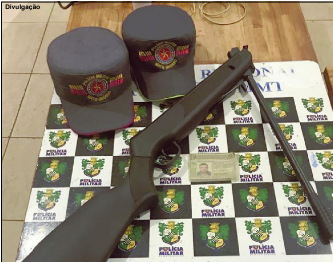
Espingarda recolhida pela PM estava com o suspeito preso

Caso aconteceu na MT-325, imediações do Porto de Areia, Rio Teles Pires