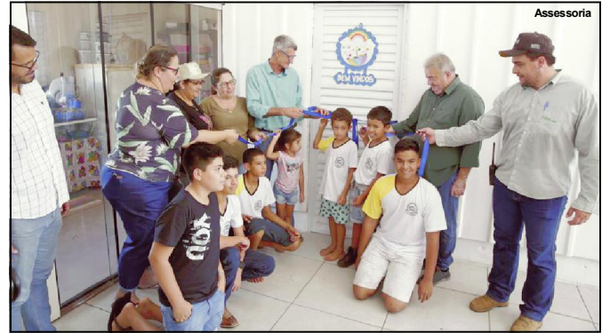
Escola Bom futuro sendo inaugurada pelo prefeito e presidente da Câmara de Alta Floresta

muita satisfação, estamos inaugurando esta escola para que estas crianças tenham acesso a educação”, frisou o Prefeito.