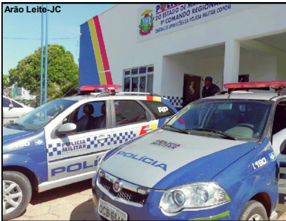
Suspeito foi conduzido à Central da PM

Homem de 30 anos foi levado para a Delegacia de Polícia Judiciária Civil de AF