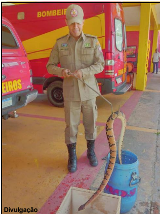
Surucucu foi capturada na região central de AF

Conforme informação, animal deve ser usado para produção e soro antiofídico