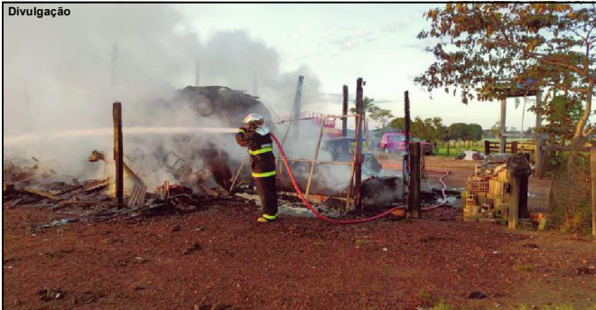
Corpo de Bombeiros atendendo caso ocorrido em AF

Corpo de Bombeiros fez rescaldo para evitar que fogo atingisse Silo