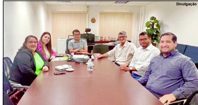
Prefeito de Alta Floresta com reitoria do IFMT na capital de MT

Em breve novas informações serão divulgadas. Acompanhem nosso portal oficial e nossas redes sociais. Para mais informações www.altafloresta.mt.gov.br e @prefeituraaltafloresta .