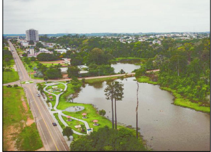
Potencial turístico da cidade será explorado e exibido em evento na capital do estado

promoção digital do turismo de Alta Floresta.