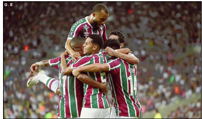
Jogadores do Fluminense comemoram gol contra o River Plate

No segundo tempo o Fluminense voltou em um ritmo acelerado, e logo aos sete minutos Cano recolocou o time na frente após assistência de Samuel Xavier. Com a expulsão de González Pires aos 22, aí que o Tricolor encontrou mais