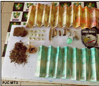
Droga apreendida pela Força Tática em Boca de Fumo em AF

Quatro pessoas foram conduzidas para a Central de Operações e Delegacia