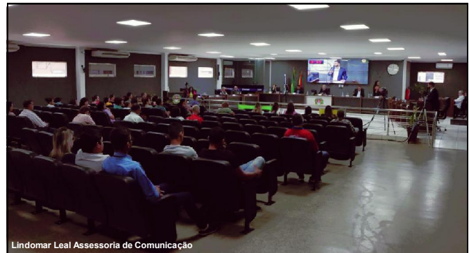
Lindomar Leal Assessoria de Comunicação

Matéria debatida na Sessão do Poder Legislativo de Alta Floresta