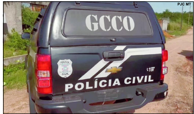
Elemento foi preso graças à investigação da Gerência de Combate ao Crime Organizado