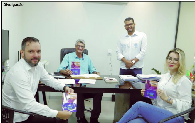
Programa ganha ainda mais prioridade em Alta Floresta