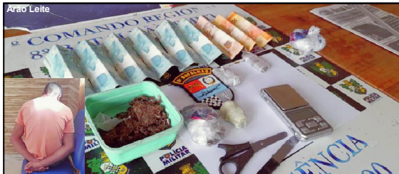
PM apreendeu várias porções de maconha, balança e dinheiro

Caso em Alta Floresta foi registrado no final de semana no Bairro Cidade Bela