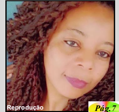
Reprodução Pág. 7

Vítima tinha 48 anos e era mãe de quatro filhos e netos