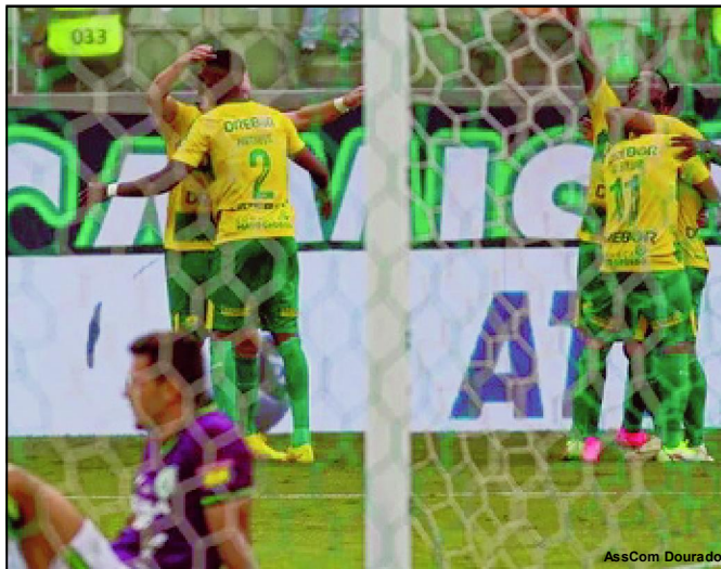
Cuiabá vence fora de casa