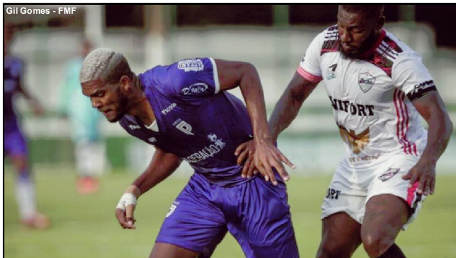
Primavera venceu o Ação por 2x1