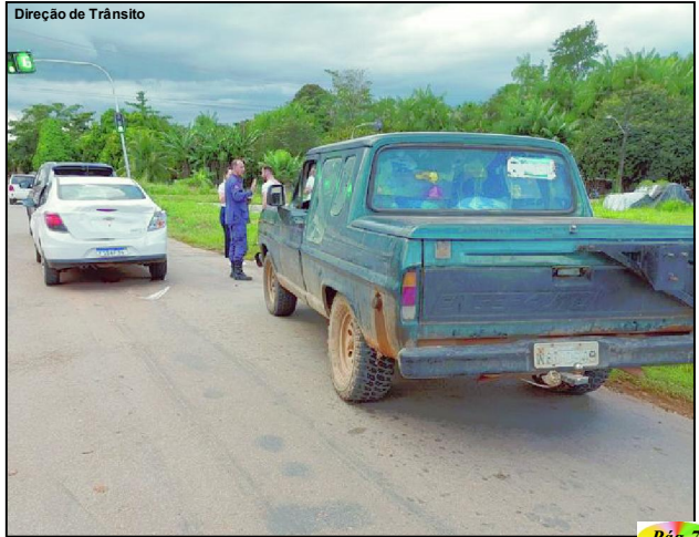
Direção de Trânsito