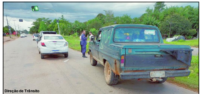
Direção de Trânsito

Conforme informações, número de acidentes com pessoas embriagadas é altíssimo