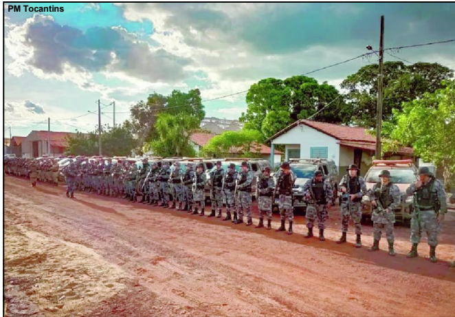
Polícia caça bandidos desde 9 de abril