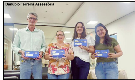
Danúbio Ferreira Assessoria

Gestão de Alta Floresta explica que cartões vão atender diversos públicos