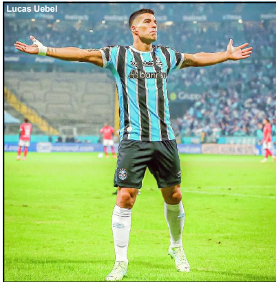
Suárez foi o nome do Grenal