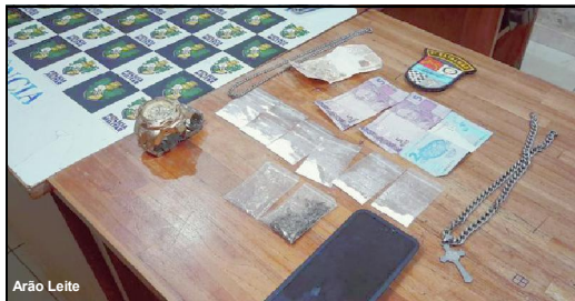
Entorpecente apreendido pela PM com menor

Caso em Alta Floresta tem como suspeitos adolescente de 16 anos e maior de 19 anos