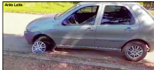
Carro que bateu em moto após invadir pista contrária

Veículo com documentação em dia foi liberado, mas o condutor foi levado à Delegacia