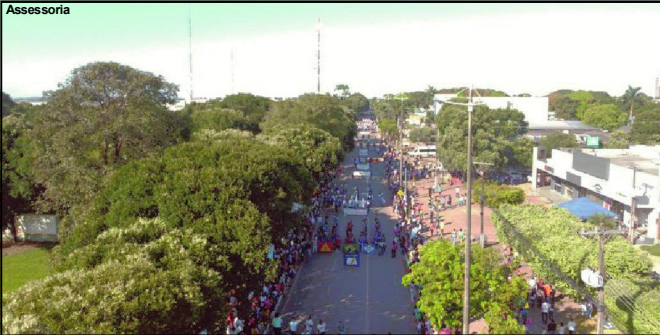
Desfile muito prestigiado por milhares de pessoas