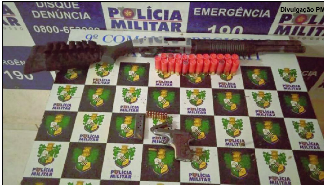
Armas apreendidas em posse do caminhoneiro em Alta Floresta

Armas e homem preso em flagrante foram encaminhados à Delegacia