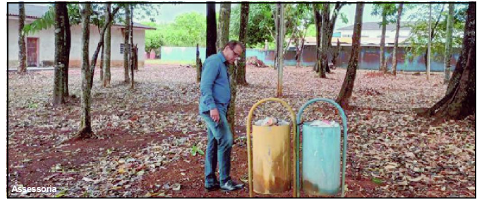
Vereador diz que investimento dará melhor qualidade de vida