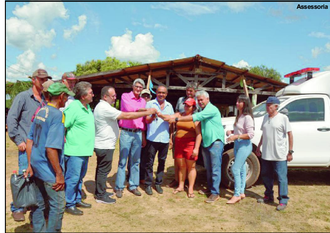
Cerimônia de entrega realizada domingo com presença de autoridades

“É certo que o ex-governador não sabia exatamente a origem da propina recebida (qual contrato efetivamente fraudado), mas tinha pleno conhecimento nas fraudes perpetradas durante a execução das obras do programa “MT Integrado”, e amplo saber sobre as Construtoras que lhe deviam o ‘retorno’, dentre elas a Construtora Rio Tocantins. A forma de operacionalização da fraude pouco lhe importava, desde que o valor exigido lhe fosse entregue conforme avençado” cita trecho da ação.