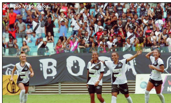
Alvinegro vence novamente e conquista classificação inédita