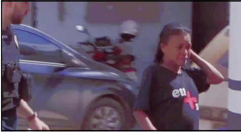
Registro feito pelo cinegrafista Diego Fernando, da TV Nativa, durante condução da presa

Delegacia acionou Polícia Técnica e laudo deverá apontar causa do óbito