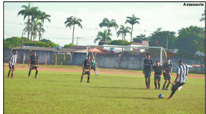
Competição reuniu atletas de várias cidades do estado