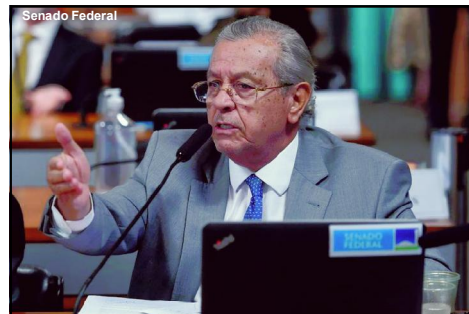
Parlamentar do União foi denunciado pelo Pros