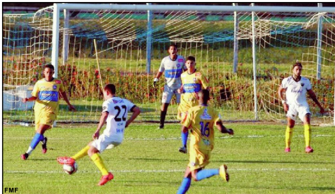
Araguaia está na final da Série B