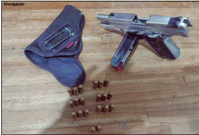
Pistola estava carregada

Armas e os suspeitos de 61 e 53 anos de idade foram conduzidos para a Delegacia