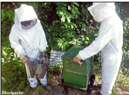
Assistência oferecida pelo serviço público tem ajudado os produtores a melhorar produção