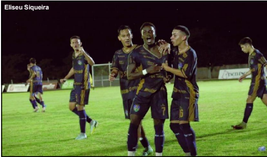
Nova Mutum estará na Copa FMF 2023