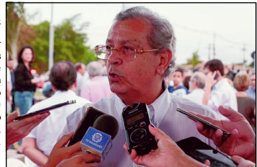
Senador pede mais rigidez contra criminosos

“Fortaleçamos as ferramentas jurídicas para combatermos o narcotráfico e o narcocídio. Esse projeto é maior e damos instrumentos ao governo através das leis”, acrescentou.