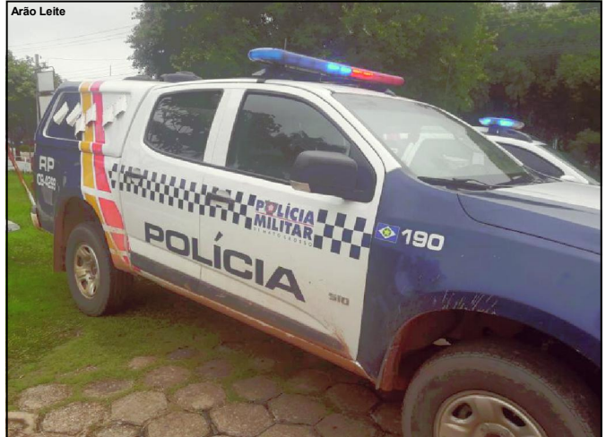
Polícia Militar foi acionada para atender caso no bairro Bom Jesus

O caso foi passado para a Polícia Civil.