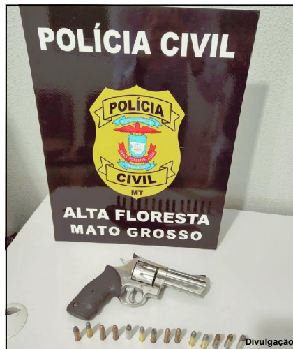
Acusado de agressão ainda tinha em sua posse uma arma de fogo

Deputados da Assembleia Legislativa de Mato Grosso (ALMT) tentam aumentar o valor do auxílio, o que também é defendido pelo conselheiro. "Só se oferece para o pescador um salário de miséria, é claro que ele vai ser contra. Agora, se for R$ 3, 4 mil. Tem que buscar alternativa para que ele possa sobreviver, sustentar a família e ter condições de manter a vida", finalizou.