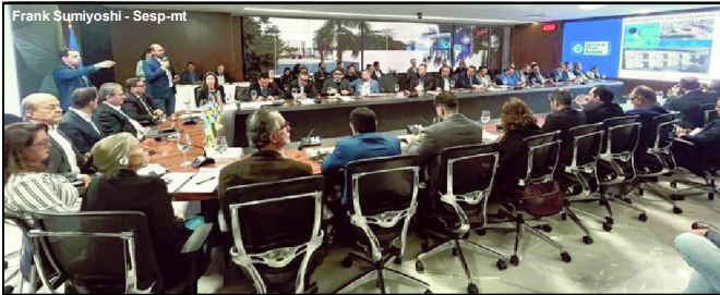
Apresentação do projeto Vigia Mais MT durante reunião das câmaras de Segurança e Meio Ambiente

Cinco Estados manifestaram interesse na adoção do modelo de monitoramento que emprega a inteligência artificial na prevenção e repressão à violência