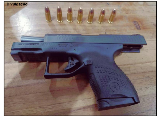
Arma foi encontrada na cintura de motorista de caminhonete

A primeira arma estava com um homem de 61 anos. O suspeito dirigia uma caminhonete Hilux quando abordado pela PM em Alta Floresta próximo ao quartel do 8º Batalhão. Na busca pessoal foi encontrada a pistola marca CZ municiada