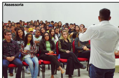
Tema bastante discutido durante evento no auditório do Instituto Federal

Em sua fala a Juíza de Direito do Fórum, lembra que, este é o caminho a ser seguido. “Vejo essa atividade educativa muito importante, por estarmos trabalhando no campo educativo. Também estamos trabalhando uma mudança de mentalidade. Além das infor-