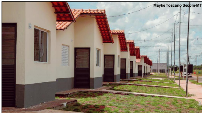
Casas do Residencial Vida Nova II, em Lucas do Rio Verde

Obras já foram iniciadas em sete municípios até o momento