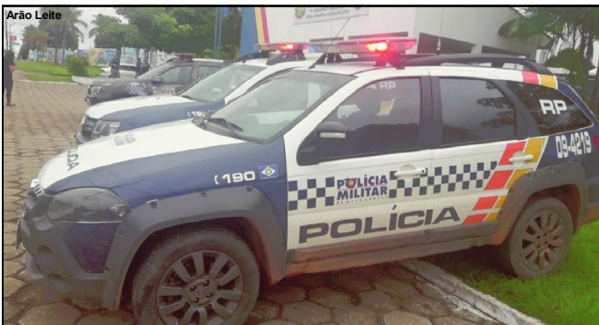
Polícia Militar foi acionada para atender o caso ocorrido domingo

Homem mesmo na frente da PM olhou para vítima e prometeu voltar