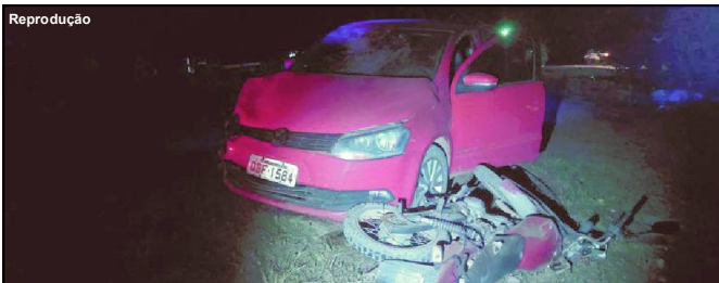
Moto entrou na via principal e foi atingida por carro, matando motoqueiro na hora

Homem de 63 anos estava em uma Honda 125 e morreu na batida contra Voyage