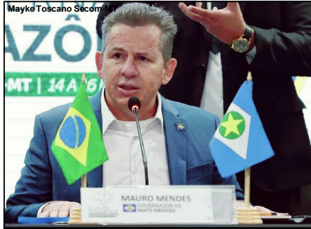
Governador de Mato Grosso fala em contra-atacar

Para se ter uma ideia, a expectativa de arrecadação do fundo para esse ano é de R$ 900 milhões. A equipe da Secretaria de Estado de Fazenda elaborou um relatório sobre o texto que deverá ser entregue ao governador nesta tarde. O documento deve embasar Mendes a sugerir alterações no Congresso Nacio-