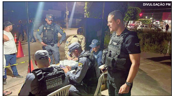
Operação Lei Seca flagra muitos motoristas embriagados em AF

Todos podem responder por crime de trânsito. E a Polícia informou na ocasião que a Operação Lei Seca deverá continuar no município e entre os focos, está coibir motoristas bêbados conduzindo motos ou carros e reduzir número de acidentes.