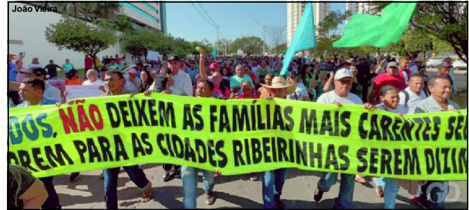
Em manifesto, pescadores pedem a deputado para não deixarem categoria dizimada

O governo estadual informou que a medida é necessária por causa da redução dos estoques pesqueiros, o que coloca em risco várias espécies nativas no estado.