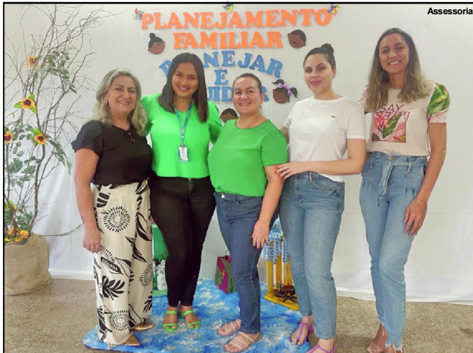
Equipe do Cras Casa da Família em Alta Floresta