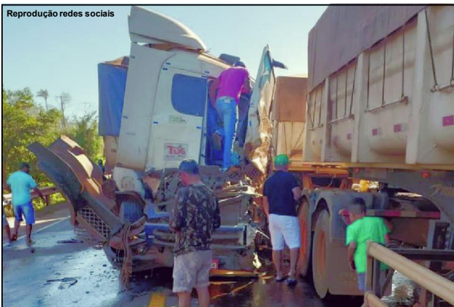
Fluxo intenso e mais uma tragédia na BR 163

O caminhoneiro que morreu ainda não teve a identidade divulgada; caso ocorreu na BR-163, em Sinop