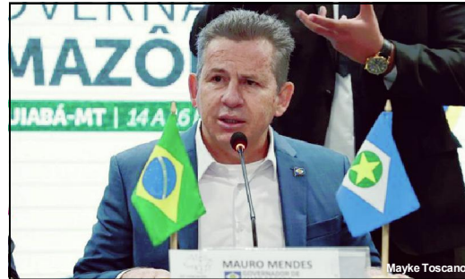
Pontuação do governador foi analisando reforma tributária

Conforme estudo realizado pela Secretaria de Estado de Fazenda (Sefaz), os preços de diversos produtos da cesta básica e da carne poderão sofrer aumentos significativos caso o texto da Reforma Tributária seja