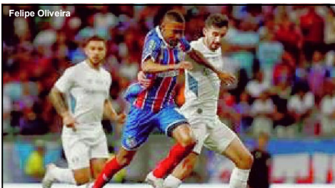
Bahia e Grêmio ficaram no empate na Fonte Nova