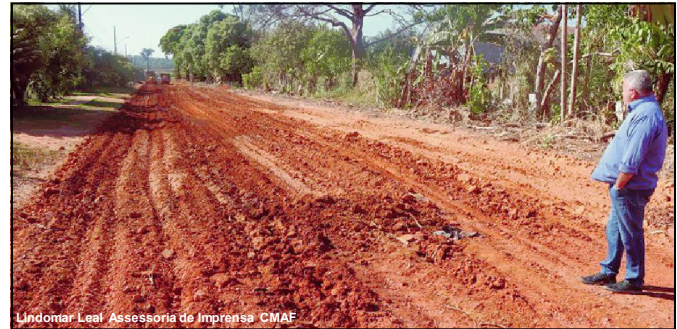
Vereador acompanhando qualidade da obra em AF

“Durante muitos anos cobramos das gestões municipais a concretização de um sonho dos moradores e agora, graças ao prefeito Chico Gamba que viu a