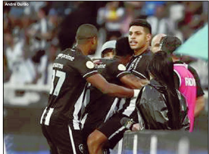
Líder Botafogo enfrenta o Grêmio neste domingo

A empresa MADEIREIRA CREMONEZZI LTDA, inscrita no CNPJ sob nº 50.065.004/0001-26, Inscrição Estadual 13.989.830-1, localizada no Município de Apiaçás-MT, torna público que requereu junto a SEMA - MT, Alteração da Razão Social com aproveitamento da Licença de Operação nº 326024/2022, Processo 602305/2019, para atividade de Serraria com desdobramento de madeiras em bruto. Não foi determinado EIA-RIMA.