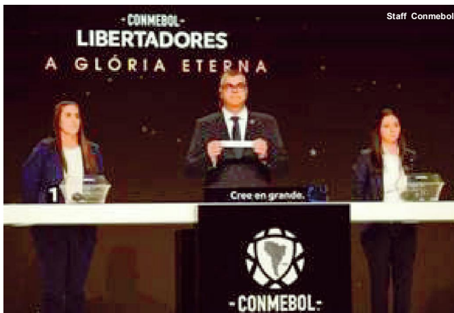
Conmebol sorteia oitavas de final