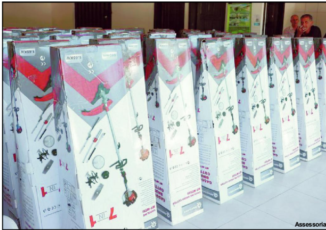
Equipamentos irão atender associações de Alta Floresta

LINDOMARLEAL Assessoria de Imprensa Câmara Municipal