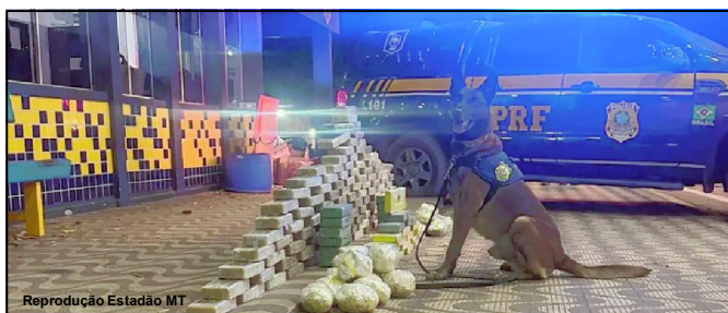
Cão farejador mais uma vez foi fundamental na ação policial contra o tráfico

GI/MT Polícia Rodoviária Federal (PRF) apreendeu 189 tabletes, que somaram quase 180 kg de substâncias análogas a cocaína e basta base, na noite de quinta-feira (13), em Rondonópolis, a 218 km de Cuiabá.