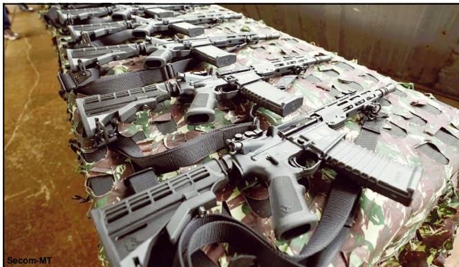
Fuzis vão reforçar aparato do Batalhão de Operações Especiais

Entrega será realizada durante abertura do 1º Simpósio Nacional de Operações Especiais, no Teatro Zulmira Canavarros, às 08h