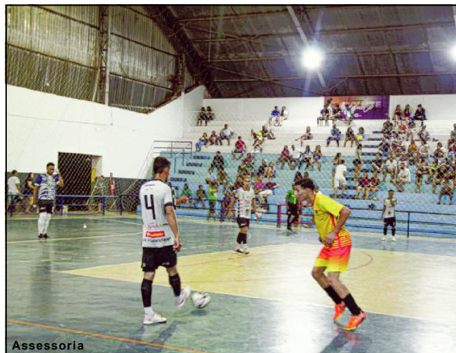
Competição movimenta setor esportivo de AF