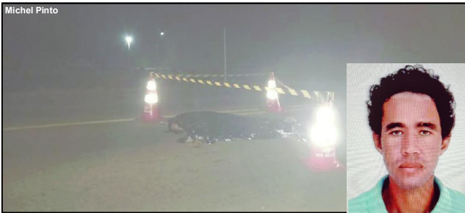
Paulinho morreu no local após ser atropelado por ônibus em AF

Vítima de 37 anos estaria segundo motorista, na pista e não houve tempo para desviar