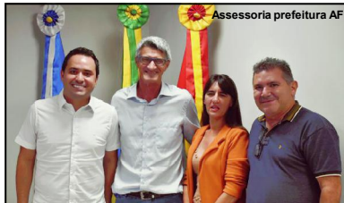
Deputado estadual, prefeito de Alta Floresta e vereadores