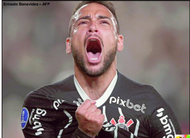
Ernesto Benavides – AFP

Corinthians e América Mineiro avançam para as oitavas de final