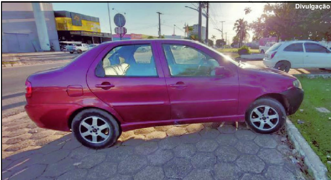
Carro pego em golpe no estado de Rondônia foi recuperado em MT

Homem de 34 anos já teria trocado produto de negociação ilícita em outro veículo