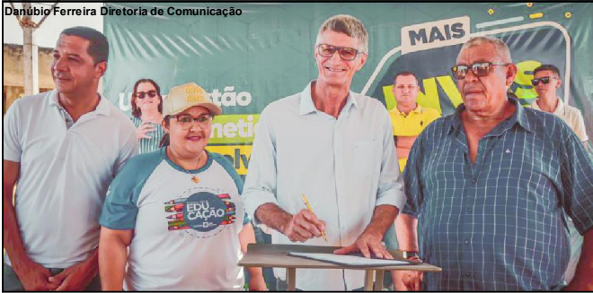
Prefeito assinando Ordem de Serviço para início da obra da unidade de educação infantil

A obra da unidade de educação infantil é no Jardim Imperial