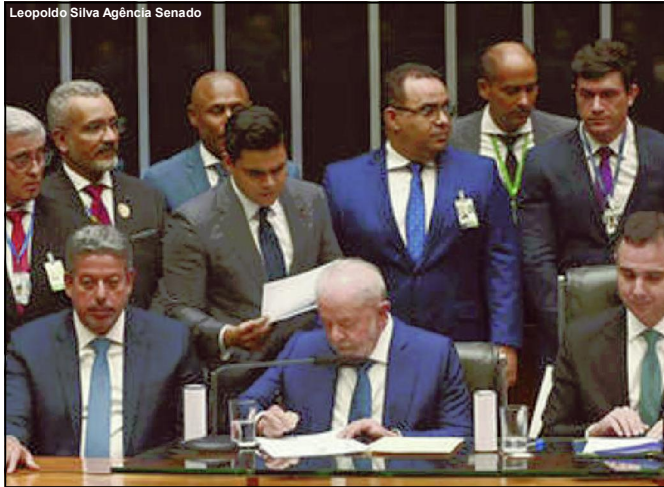
Lira, Lula e Pacheco durante posse presidencial, em 1º de janeiro