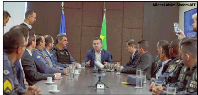
Governador ao falar sobre abordagem em Cotriguaçu, pede apuração rigorosa