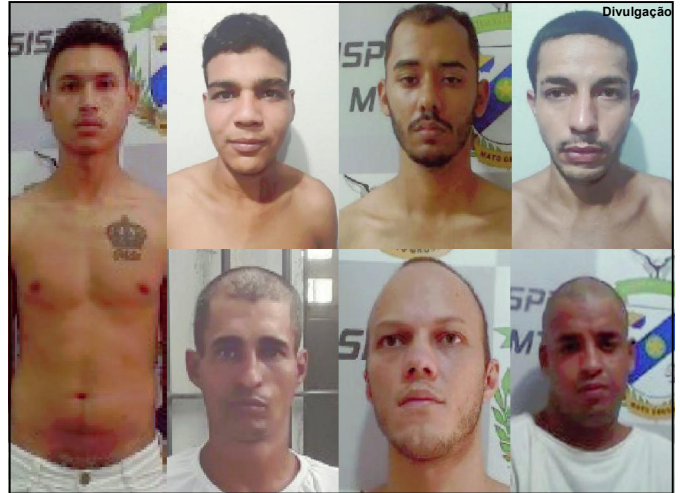
Fugitivos são considerados perigosos

O homem que tentou estupro a mulher desapareceu, mas a delegada acredita que não deve ficar muito tempo sumido. “Pedimos sua prisão preventiva e estamos procurando para que ele seja preso e não venha a cometer novamente esse tipo de crime contra ninguém”, finalizou.