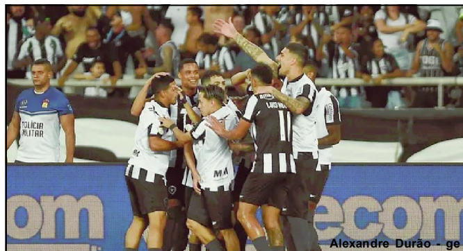
Jogadores do Botafogo comemoram gol contra o Internacional

O camisa 10, no entanto, sofreu com problemas físicos e somou 173 jogos no Paris Saint-Germain, uma média de pouco mais de 28 por temporada. No período, o clube teve 318 partidas oficiais. O brasileiro fez 118 gols e 70 assistências na equipe parisiense e conquistou 13 títulos, entre eles, cinco edições do Campeonato Francês, além do vice-campeonato da Champions League em 2020.