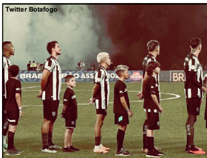
Botafogo segue líder isolado do Brasileirão