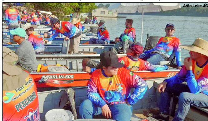
Festival de Pesca atraiu dezenas de equipes de toda a região

resultado de tanta disputa foi a captura de quase 500 peixes em poucas horas de competição, vencida ao final pela equipe Biguá, do município de Carlinda. Os dois irmãos e um cunhado físgaram e mediram mais de 50 peixes. Eles levaram R$ 6 mil e troféu como premiação.