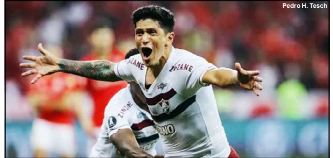
Germán Cano é artilheiro da Libertadores 2023

Fernando Diniz deve mandar o Fluminense a campo com: Fábio; Samuel Xavier, Marlon, Felipe Melo e Marcelo; Martinelli, André, Ganso, Árias, John Kennedy; Cano.