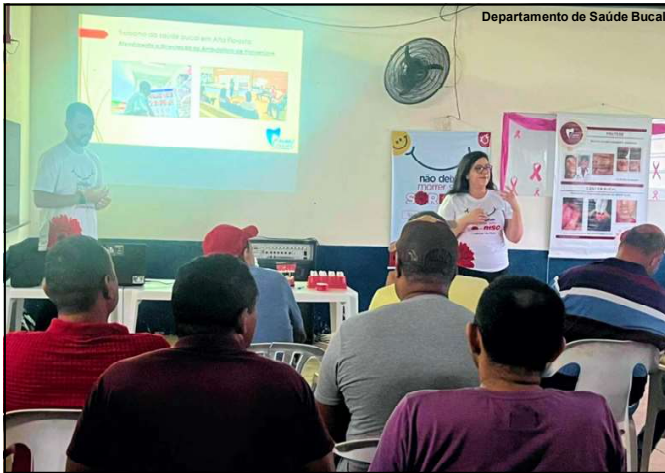
Palestra durante ações em Alta Floresta