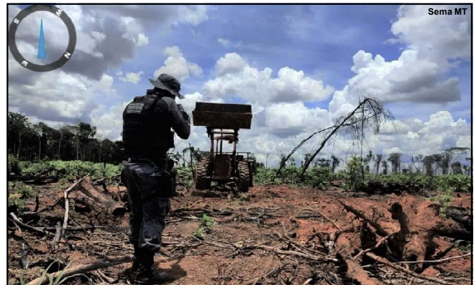
Desmatamento autuado pela Sema na região norte do estado

Confresa Porto Dos Gaúchos Santa Carmem São Félix Do Araguaia Tapurah Vila Rica