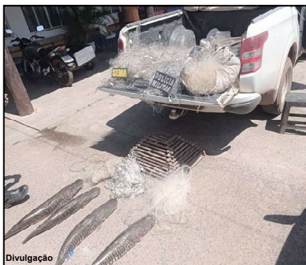
Operação Piracema é realizada em Mato Grosso

Em atendimento a uma denúncia recebida pelo canal da Ouvidoria da Sema-MT, os agentes recolheram parte do material utilizado para pesca predatória na região da Praia Grande, em Várzea Grande. No município de Barão de