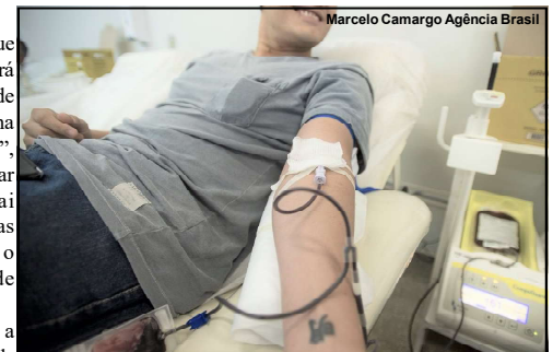
Na semana do doador, Unidade de Coleta em AF chama voluntários

A unidade está localizada em prédio anexo ao Hospital Regional de Alta Floresta.