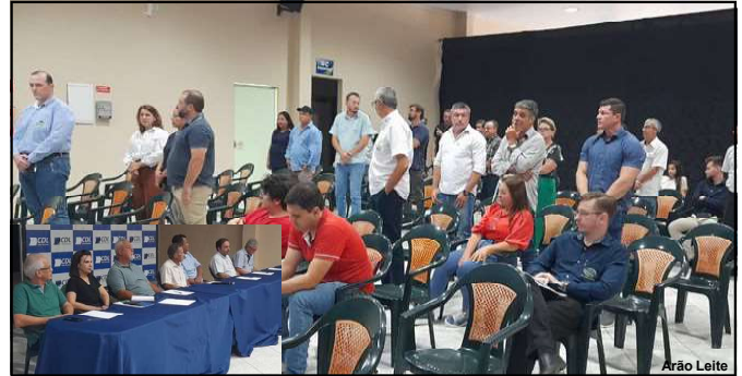
Lojistas levantaram dizendo não à prorrogação de gestão atual e requerendo mudança

Os empresários, na justificativa, não questionaram a gestão que tem se revezado no caso de alguns diretores, ao longo de anos, mas alegaram que “é necessária a mudança para dar direito a novos empresários, ouvir novas ideias e apresentar novos projetos para Alta