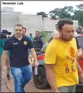
Pedreiro que matou uma mulher e as três filhas dela detalhou vítimas agonizando na hora dos estupros