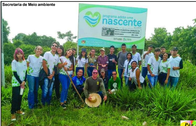
Secretaria de Meio ambiente