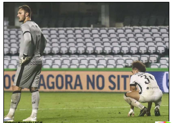
Gabriel Machado / AGIF