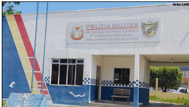
Central de Operações da Polícia Militar em Alta Floresta

Conforme o mesmo documento “a Escala de Serviço da Guarda do Quartel será expedida pelo 9º Comando Regional; A função de Graduado de Dia do 8º BPM ficará sob subordinação direta ao Comandante da UPM e os policiais militares em Jornada Extraordinária serão empregados na suplementação do policiamento ostensivo da UPM”.