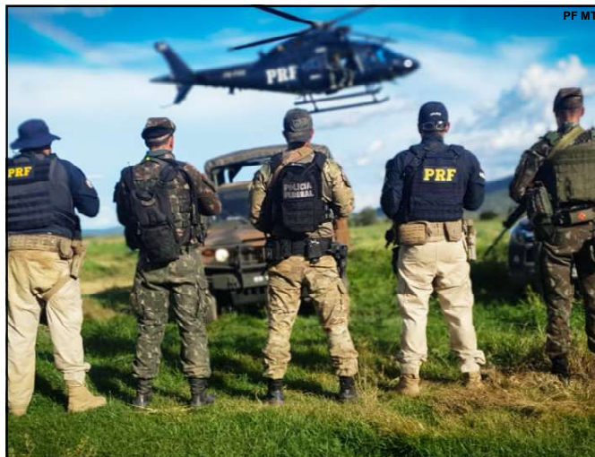
Em MT, força-tarefa sempre age para desocupar garimpo ilegal em várias terras indígenas