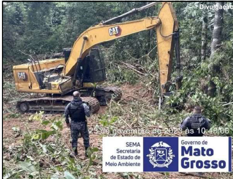
Máquina apreendida em flagrante da PM e Sema em Mato Grosso Navara Takahara Sema-MT

Crime foi constatado durante fiscalização e infratores são multados em R$ 10 milhões