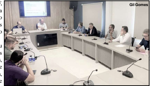
Conselho técnico do Mato Grossense 2024

Campeonato Mato Grossense Série A: Cuiabá, Mixto, Dom Bosco, Operário VG, União de Rondonópolis, Luverdense, Nova Mutum, Primavera, Araguaia e Academia.