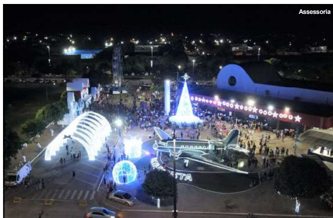
Praça da Cultura vira cartão de Natal em Alta Floresta

Abertura Oficial do Natal Eu Amo Alta Floresta é sucesso de público e viraliza nas redes sociais