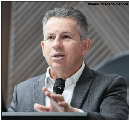
Aumento do ICMS impactaria a economia