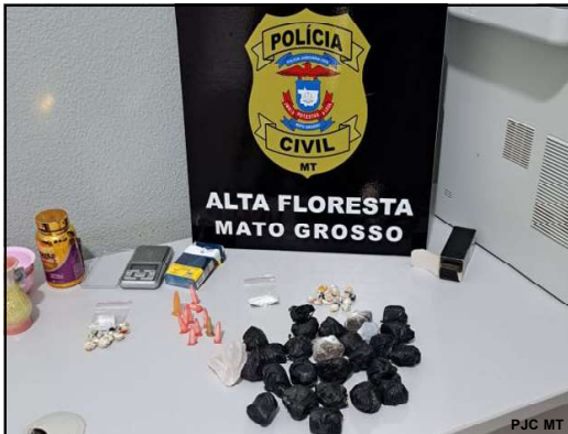
Droga apreendida pela Polícia Civil em Alta Floresta

A ação resultou na prisão em flagrante do investigado e na apreensão de mais de 60 porções de entorpecentes