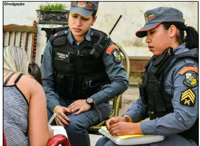
Programa tem o objetivo de encerrar ciclos de violência doméstica, resgatar a sensação de segurança e dignidade das vítimas

“Me sinto honrada por ser uma mulher que ajuda outras mulheres por meio da Patrulha Maria da Penha desde toda a criação e formulação do trabalho, da instrução normativa e da capacitação e acredito que possamos fazer ainda mais para que as mulheres saiam do ciclo de violência. A Patrulha vem proporcionando o resgate do direito à