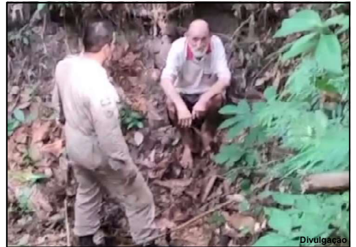
Idoso foi encontrado em mata a cerca de mil metros de onde desapareceu

Paranaíta. O morador da Comunidade Jardim do Éden foi visto caminhando pela última vez na tarde do dia 8, à beira da estrada. Preocupada, a família no sábado cedo acionou o Corpo de Bombeiros que encaminhou militares ao resgate. Só que no sábado, mesmo com um dia de buscas nada foi encontrado. Porém, no domingo pela manhã os militares o encontraram caído em uma ribanceira. “Ele não conseguiu sair de lá e felizmente o encontramos”, contou soldado BM Fagundes.