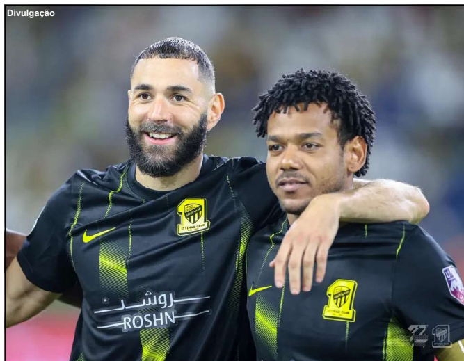
Benzema e Romarinho são destaques do Al-Ittihad

A contratação de Luiz Gustavo teve uma participação importante de Rafinha. Os dois têm uma grande amizade dos tempos de Bayern e o lateral-direito fez o "meio de campo" nas negociações.