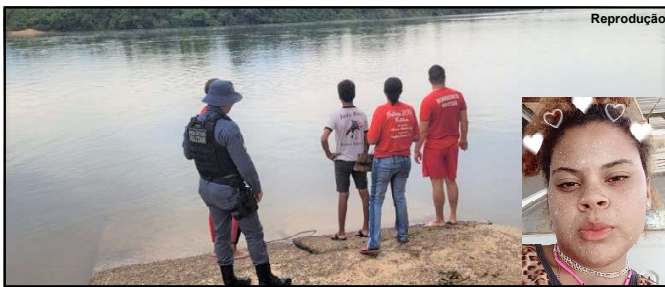
Bombeiros e Polícia Militar com familiares no local da tragédia

Menor de 17 anos não sabia nadar e seu corpo foi encontrado no domingo, dia 10