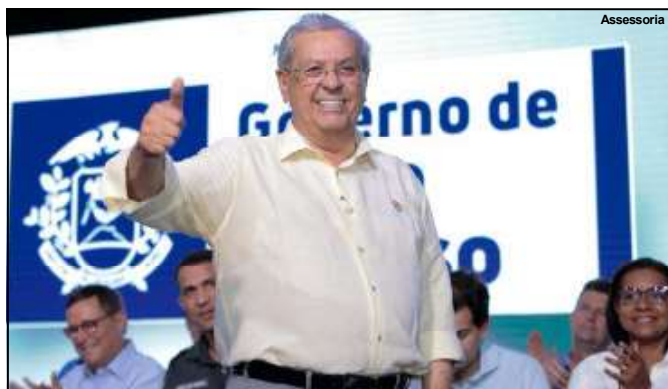
O senador Jayme Campos diz que não tem medo de ninguém, numa eventual disputa pelo Governo, em 2026