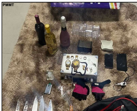
Objetos flagrados com ladrões durante a madrugada após arrombamento

Em pouca conversa já assumiram que os produtos eram provenientes de uma casa que arrombaram, que no local não haviam ninguém quando violaram a cerca