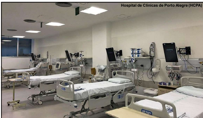
Força tarefa para mante UTI's lotadas durante a pandemia

Conforme investigação, pacientes aptos a sair da UTI não eram liberados pelos médicos que tentavam obter mais ganhos com internações. Ao todo, 15 médicos são réus no processo na Justiça de Mato Grosso.