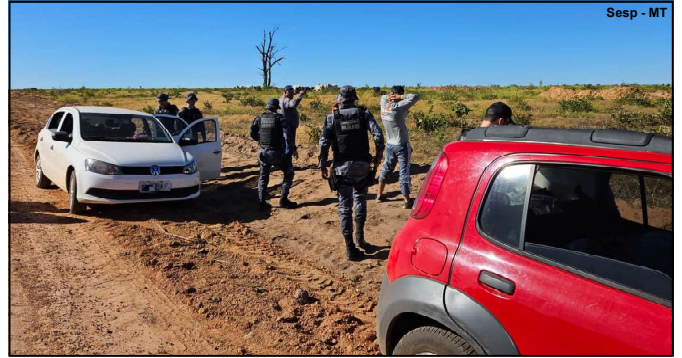
Policiais impediram invasão de terras de uma fazenda em Poxoréu

Além de um monitoramento constante realizado pela Secretaria Adjunta de