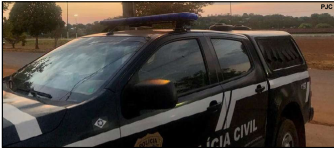
Mandante de homicídio teve mandato de prisão cumprido em VG