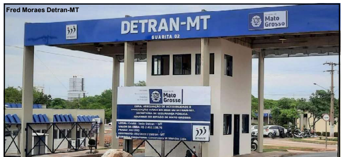
Sede do Detran-MT, em Cuiabá