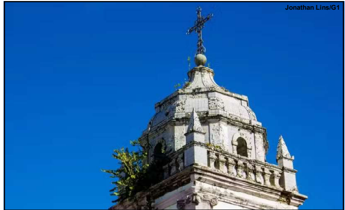
A investigação apura um suposto esquema de desvio e uso irregular de bens públicos, além de irregularidades na execução de contratos do município