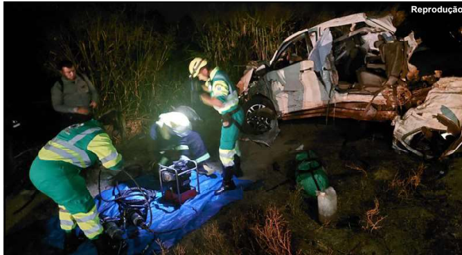
Resgate da vítima na noite de sexta-feira na MT-320

O caso envolvendo os três veículos deverão ser investigados.