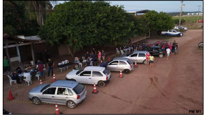
Bloqueio ocorrido no final da tarde de domingo em Alta Floresta

carro ou moto ou tem veículo irregular. Mas asseguramos que nessas ações da Lei Seca tem gerado bons resultados como redução de homicídio, roubos, prisão de foragidos, traficantes, entre outros casos”, resumiu major Cunha, comandante do 8º Batalhão da PM.