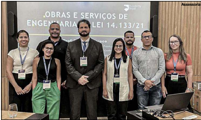
Evento foi realizado na cidade de Sinop

Diretoria de Comunicação Federal nº 14.133/21, onde foram abordados aspectos práticos e teóricos de Obras e Serviços de Engenharia na Lei da legislação. O objetivo é aperfeiçoar