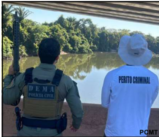
Ação aconteceu quinta-feira, na zona rural de Nova Bandeirantes

O trabalho integrado constataram que os infratores continuam danificando florestas nativas; inquérito policial foi instaurado pela Dema