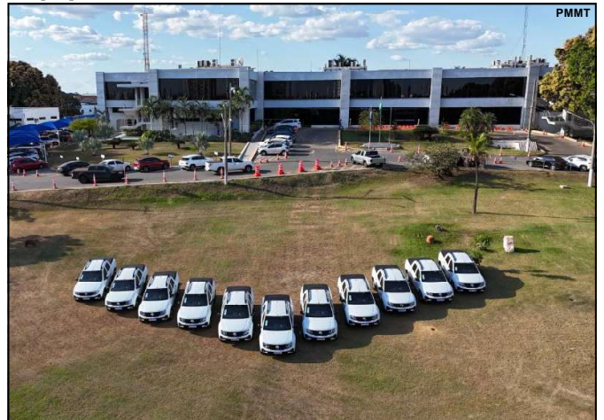
Novas viaturas reforçam frota no estado de Mato Grosso

esforços foi possível a criação desta nova coordenadoria na Polícia Civil, que faz parte da porta de entrada do atendimento de defesa da mulher, completada pelo programa social do Ser Família Mulher. Para nós é realmente uma entrega muito importante, uma entrega simbólica, que vai representar, o que todos esses profissionais, homens e mulheres, estão fazendo no estado de Mato Grosso, ampliando esse programa de proteção à mulher, desde a entrada no atendimento até o projeto social, em que a vítima é resgatada e sair do ciclo de violência”, disse o secretário.