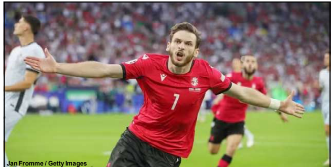
Kvaratshelia comemora gol frente a Portugal