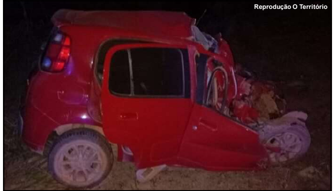
Reprodução O Território