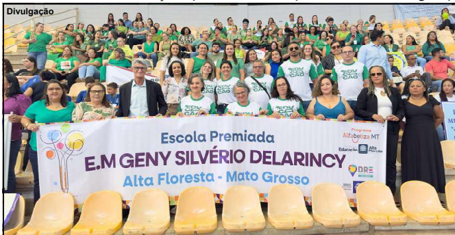
Evento na capital do estado com representantes de AF

O suspeito foi detido e encaminhado a Polícia Civil.