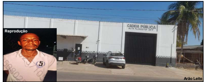
Homem de 30 anos estava preso por homicídio em Carlinda