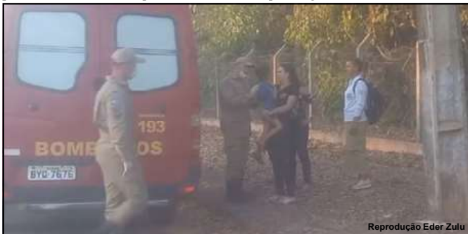
Mãe e criança foram socorridos pelos bombeiros

As duas vítimas após receberem os primeiros socorros foram encaminhadas ao Hospital Regional.