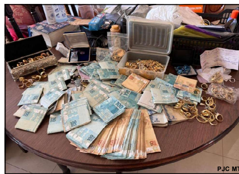
PJC prendeu advogada, comparsa, apreendeu muito dinheiro e joias nas casas das duas mulheres

Ordens Judiciais foram cumpridas durante ação da DEEF na capital do estado