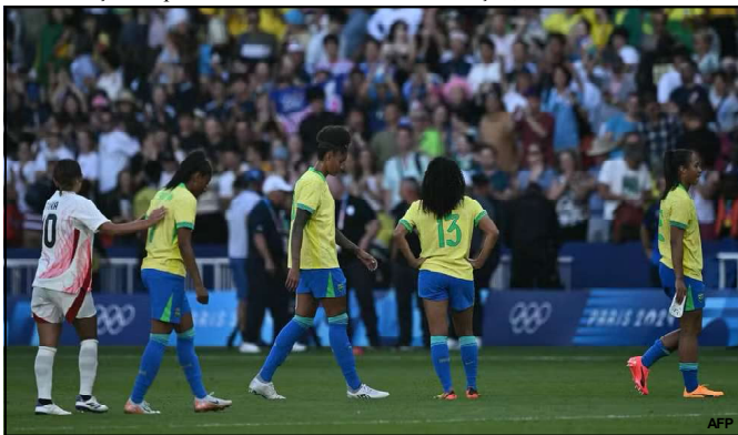
Brasil perde de virada nos acréscimos contra o Japão

O Botafogo sofreu dura derrota antes de o Flamengo entrar em campo, o Glorioso foi derrotado pelo Cruzeiro por 0x3 no Nilton Santos e viu o rival ultrapassar na tabela de classificação. O Palmeiras também sofreu dura derrota em casa para o Vitória e caiu da segunda para a terceira colocação.