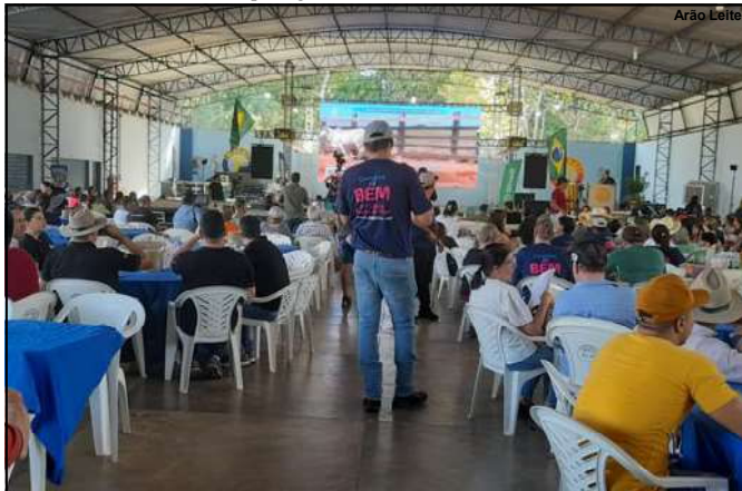
População mais uma vez participou e Comitiva arrecadou quase 2,2 milhões

A comissão organizadora nesta segunda-feira fechava o balanço do evento. Mas a comemoração já aconteceu, considerando, segundo o presidente da Comitiva do Bem que foram arrecadados mais de de dois milhões e 181 mil reais.