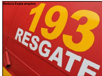
Bombeiros foram acionados para resgatar vítima e encaminhar ao hospital