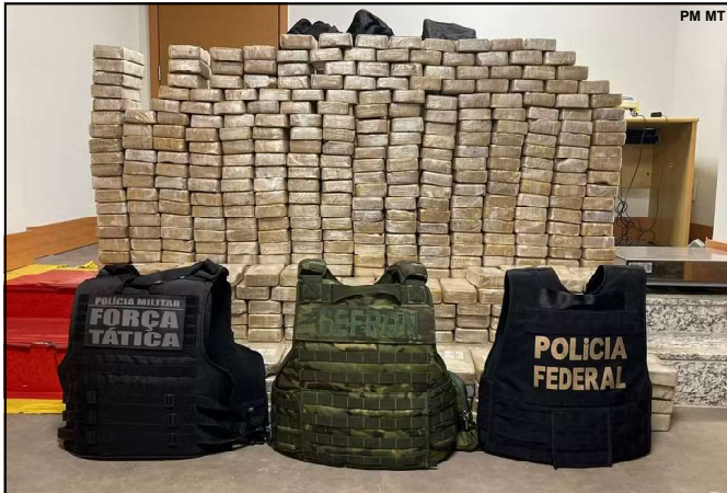
Mega apreensão é resultado de operação conjunta em Mato Grosso