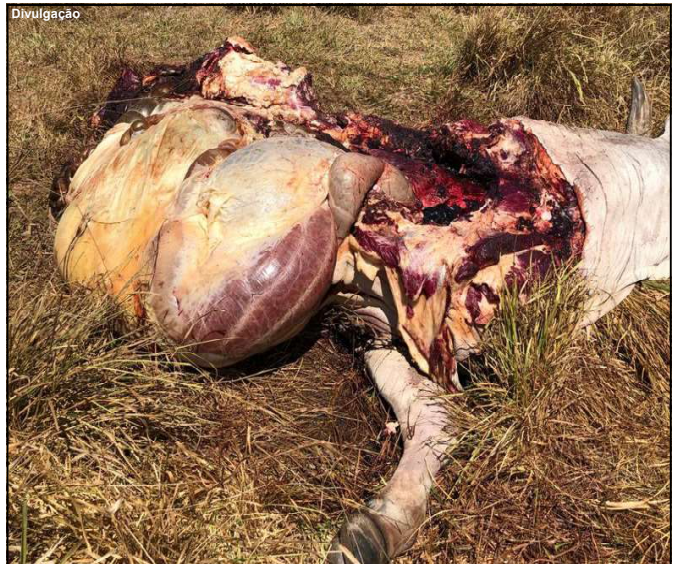
O animal após ser abatido, foi esquartejado e desossado parcialmente dentro do pasto onde estava isolado dos outros bovinos da fazenda

Outro produtor vizinho disse que ao longo dos anos já perdeu pelo menos nove animais. “Perdemos as contas já. E com certeza são as mesmas pessoas. A gente espera pegar uma hora, mas eles parecem estudar bem o local”, contou a fazendeiro que também está no aguardo de uma investigação.