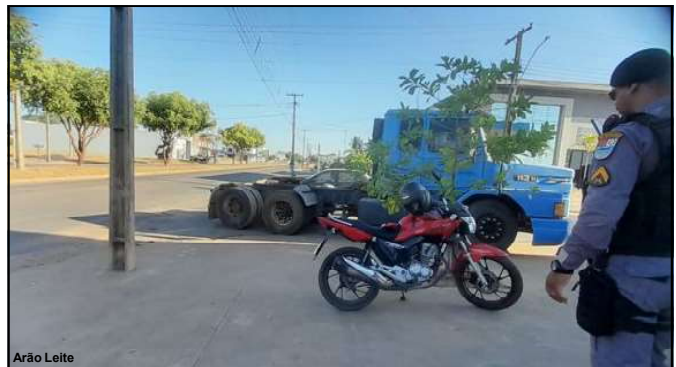
Moto da vítima e Polícia Militar registrando a ocorrência

Caso em Alta Floresta aconteceu sábado à tarde na Perimetral Rogério Silva