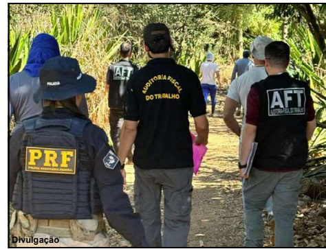
Ação conjunta em Mato Grosso mostra rigor